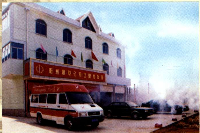
图2 又一家农村专卖店开业

发展战略： 主精副强、保持可持续发展；做大大红鹰、利群、旗鼓、香溢四大品牌；正确处理改革、发展、稳定的关系，坚持规范、改革、创新、发展一起抓，两个文明建设一起抓；强化品牌基础、市场基础、多业基础、管理基础、人才基础，开创物质文明和精神文明建设的新局面。